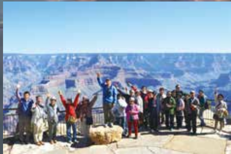
グランドキャニオンツアー 2013 より

地の深みは 主の御手のうちにあり、 山々の頂も主のものである。 海は主のもの。 主がそれを造られた。 陸地も主の御手が造られた。 詩篇九五篇4~5節