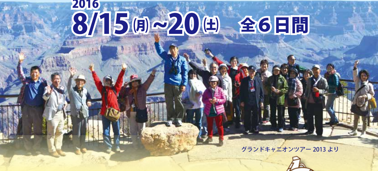
グランドキャニオンツアー 2013 より