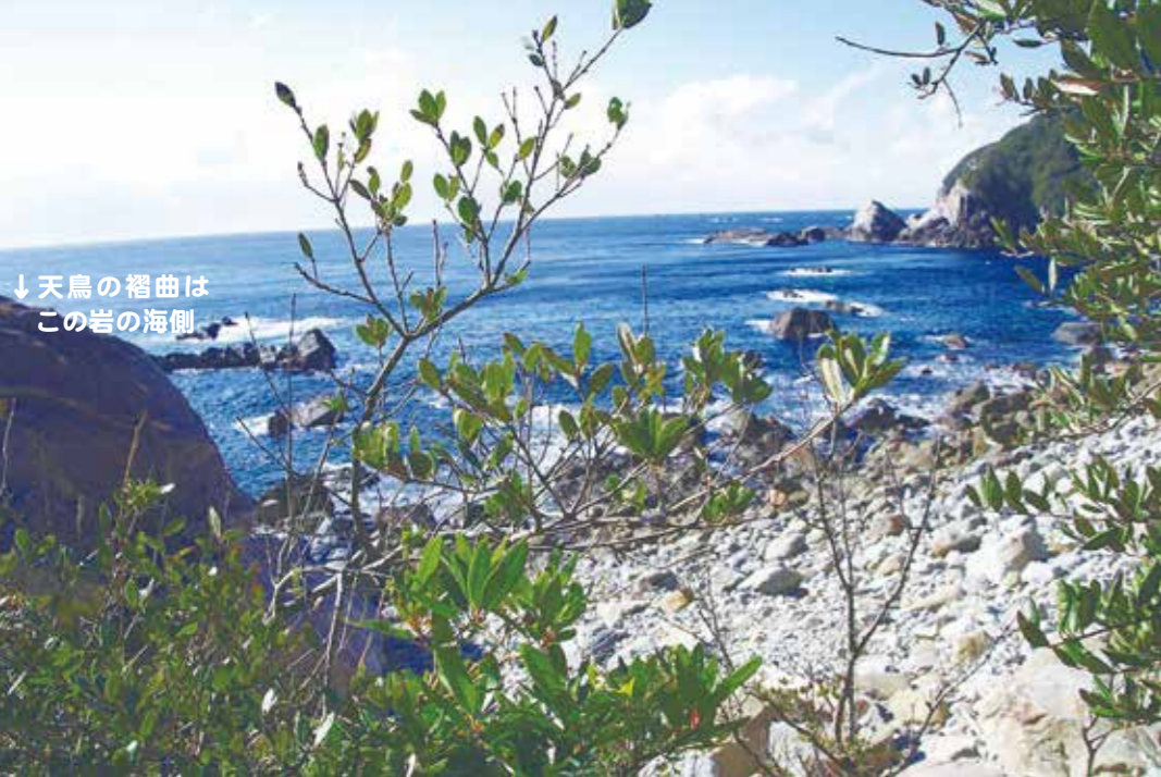
↓天鳥の褶曲は この岩の海側