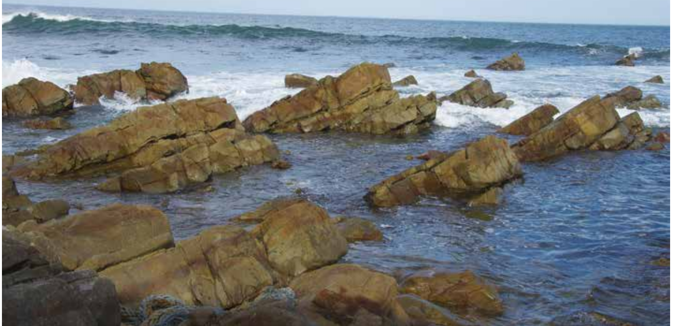
写真/那珂湊層群と呼ばれ、斜めに傾いた砂岩層が約3kmに渡って磯となって波間から顔を出しています。